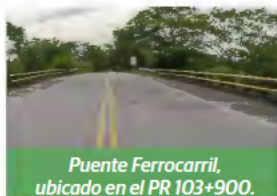
Puente Ferrocarril, ubicado en el PR 103+900.