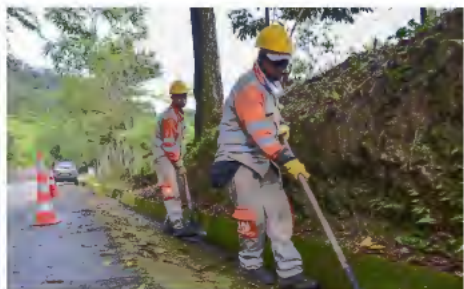
Personal de la Concesionaria Autopista Río Magdalena efectúa limpieza de cunetas, para permitir que el agua fluya sin dañar la estructura de la vía.