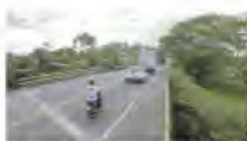
Puente Copa de Barro, situado en el PR102+878