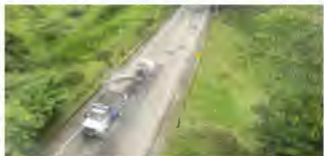
La Concesionaria Autopista Río Magdalena realiza intensas jornadas de parcheo y rehabilitación del pavimento, con el fin de mantener la vía en perfectas condiciones de transitabilidad, para beneficio de los usuarios.