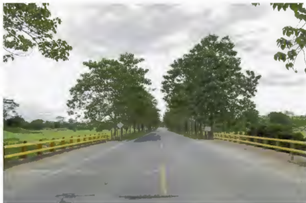
Puente Copa de Barro, situado en el PR102+878

Las pruebas se efectuaron el 8, 9 y 10 de agosto pasado, de 11:00 de la noche a 5:00 de la madrugada de día siguiente, para no afectar el alto tránsito vehicular que registra esta vía en horas del día y las primeras horas de la noche.