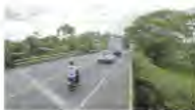
Puente Copa de Barro, situado en el PR102+878