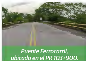
Puente Ferrocarril, ubicado en el PR 103+900.