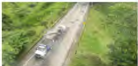
La Concesionaria Autopista Río Magdalena realiza intensas jornadas de parcheo y rehabilitación del pavimento, con el fin de mantener la vía en perfectas condiciones de transitabilidad, para beneficio de los usuarios.