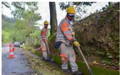
Personal de la Concesionaria Autopista Río Magdalena efectúa limpieza de cunetas, para permitir que el agua fluya sin dañar la estructura de la vía.