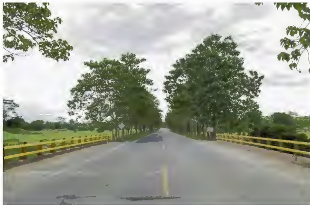
Puente Copa de Barro, situado en el PR102+878

Las pruebas se efectuaron el 8, 9 y 10 de agosto pasado, de 11:00 de la noche a 5:00 de la madrugada de día siguiente, para no afectar el alto tránsito vehicular que registra esta vía en horas del día y las primeras horas de la noche.